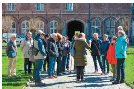
Natuurwandeling Arenberg, april