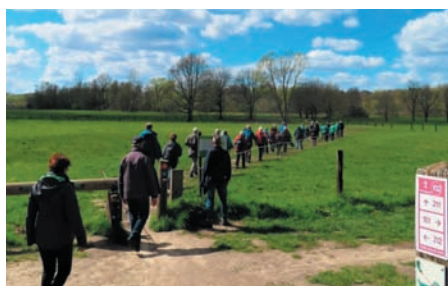
Stappers: Doode Bemde, april