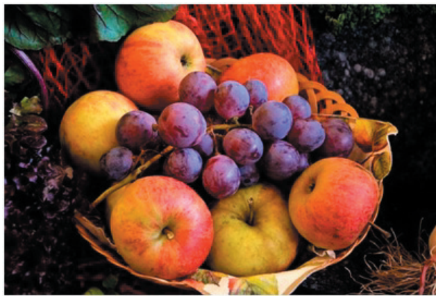
Fruit, Fruit Mand, Druiven, Appels

Als ik naar mezelf kijk, dan is mijn weg helemaal anders gelopen dan als ik zelf had gepland en gedroomd. Er zijn heel wat dingen en vooral mensen op mijn weg gekomen, waar ik geen weet van had. Maar die mijn weg hebben bepaald en gemaakt tot de persoon, de mens die ik nu ben. Ik ben niet de weg gegaan die ik had gedroomd (bepaald), maar