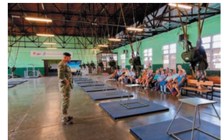
Paracommando Schaffen, juni