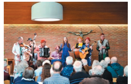
Hudaki, Oekraïense groep