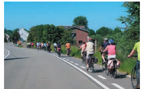
Fietsers, Precot, mei