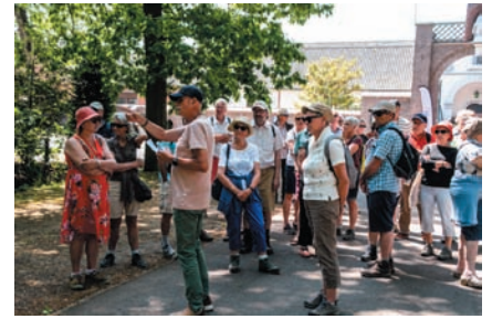
Wandelaars, Achel-Hamont, juni